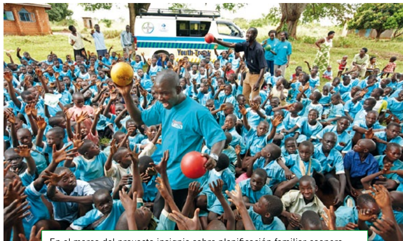
En el marco del proyecto insignia sobre planificación familiar cooperamos con instituciones públicas y organizaciones no gubernamentales.

Para más información al respecto, consulte www.bayer.com/de/El-Programa-Climatico-de-Bayer.pdf