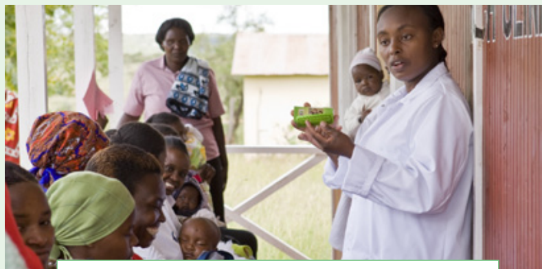
Abastecimiento de medicamentos: el objetivo es hacer posible el acceso de todas las personas a los medicamentos y servicios sanitarios.