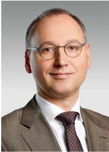
Saludos cordiales, Werner Baumann, CEO of Bayer AG

Última actualización miércoles - marzo 18, 2020 | Copyright © Bayer Centro América y el Caribe https://centroamerica.bayer.com/es/nuestro-compromiso-durante-la-pandemia-de-coronavirus.php