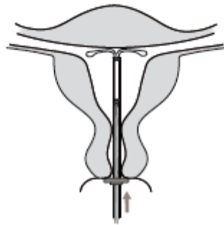
Figure 6 : KYLEENA en position fundique