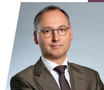
WERNER BAUMANN Vorstandsvorsitzender der Bayer AG