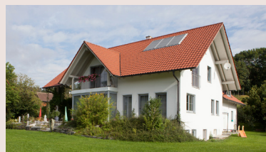
Vid s CRVO